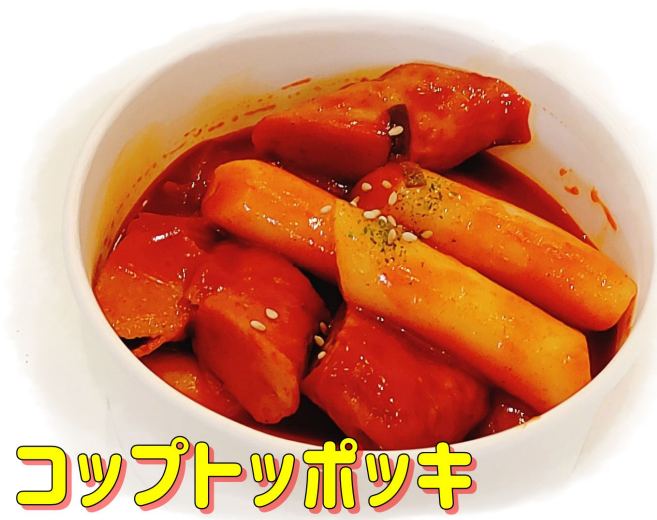
コップトツポッキ